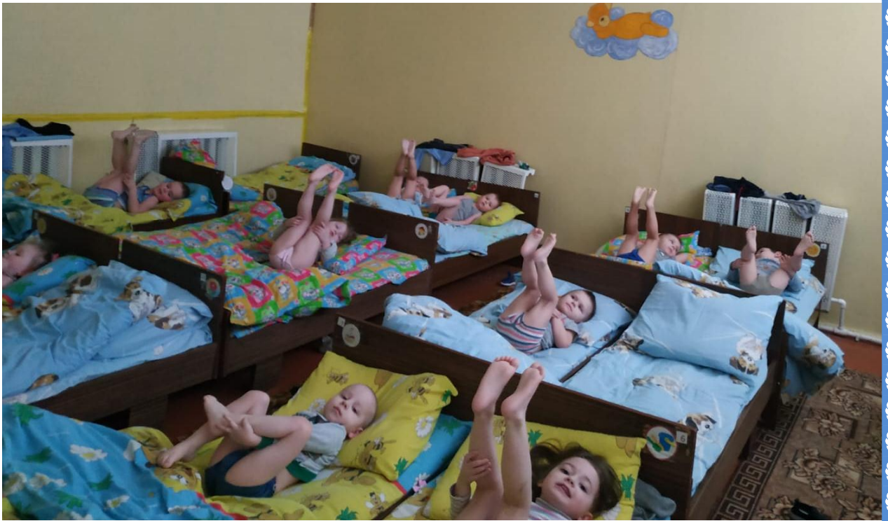
Гимнастика после сна