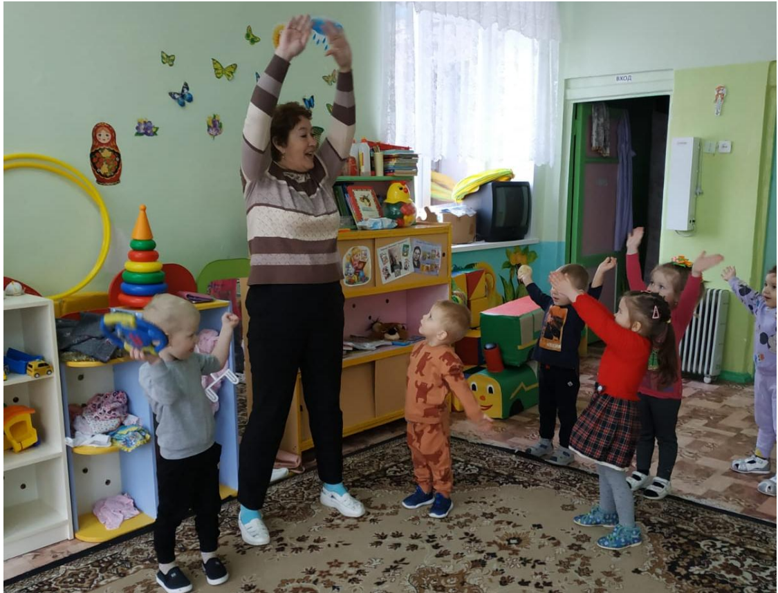
Физкультурное развлечение «Малыши-крепьши»