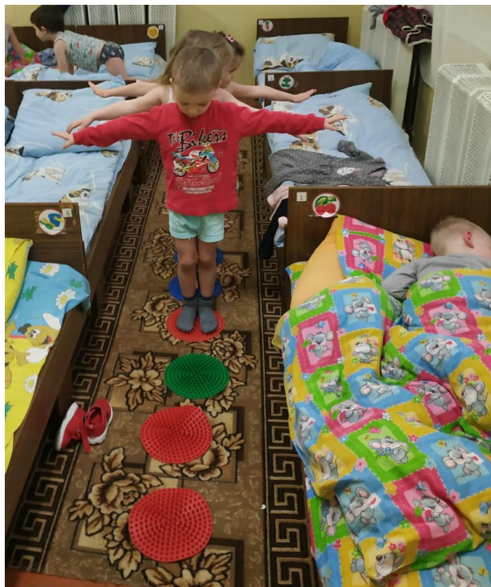
Ходьба по дорожке здоровья