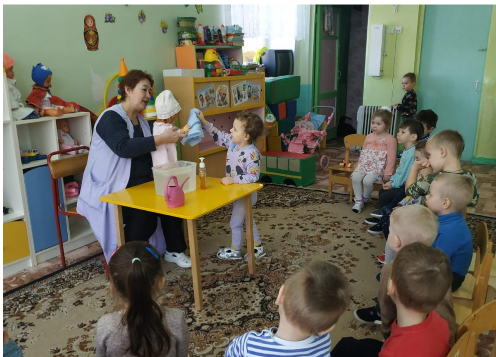
Практическое упражнение «Кукла Маша моет руки, умывается»