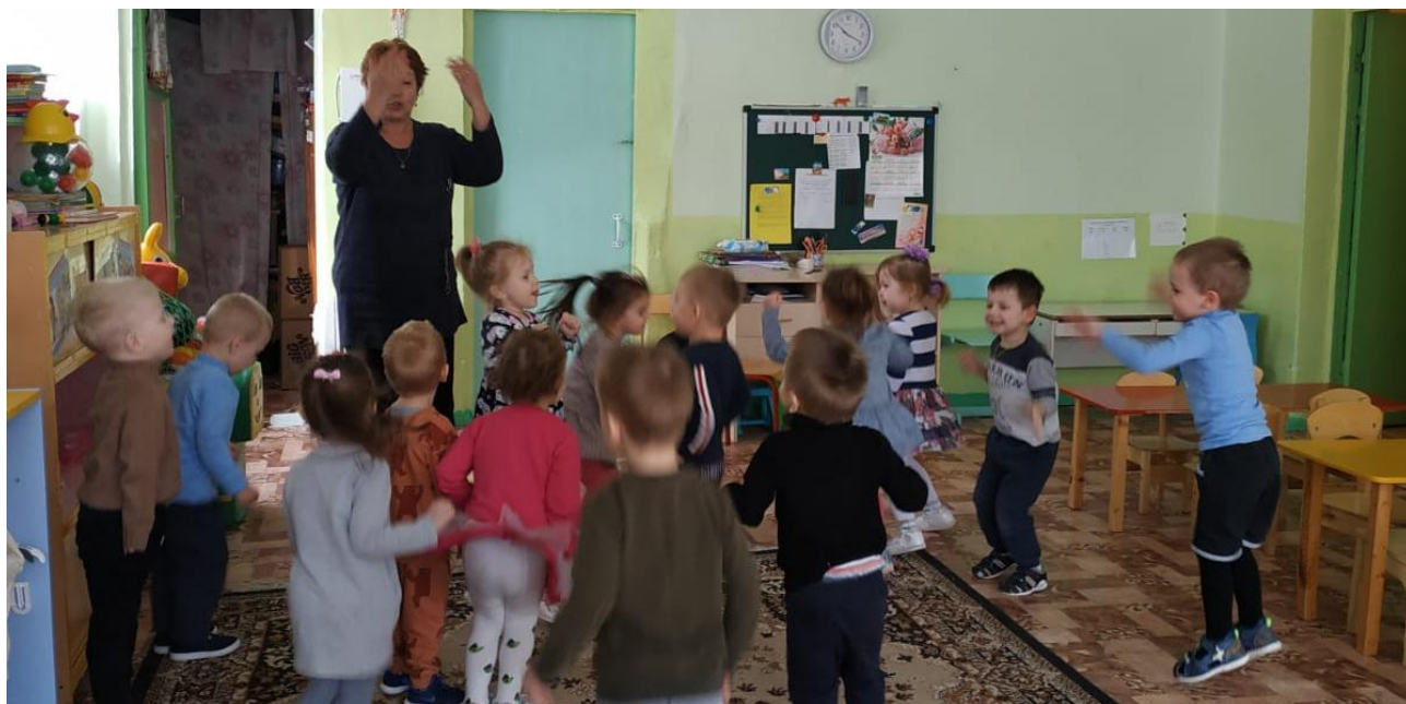
Утренняя гимнастика под музыку