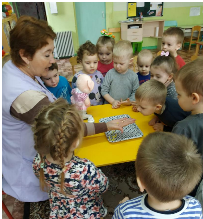
Хрюша рассказывает ребятам о витаминах