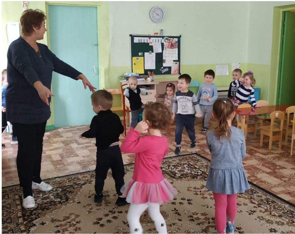
Подвижные игры в течение дня