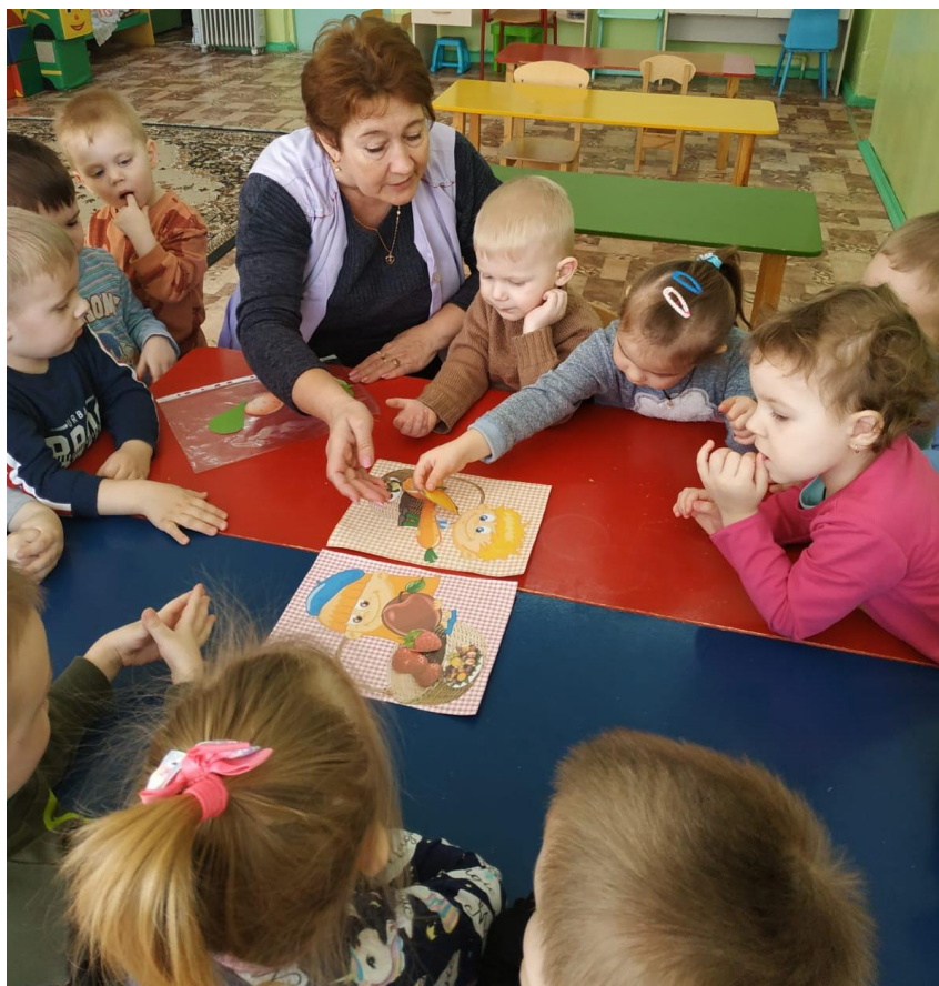
Дидактическая игра «Разложи фрукты и овощи по корзинкам»