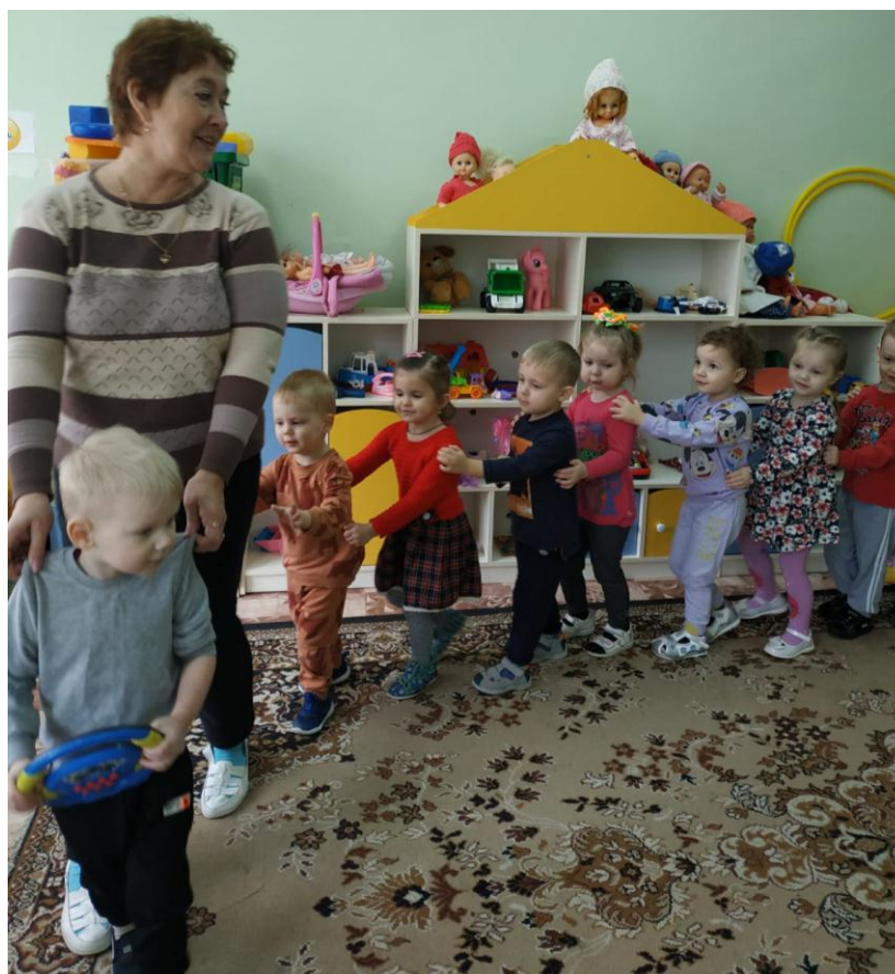
Игровая ситуация: «Едем на автобусе»