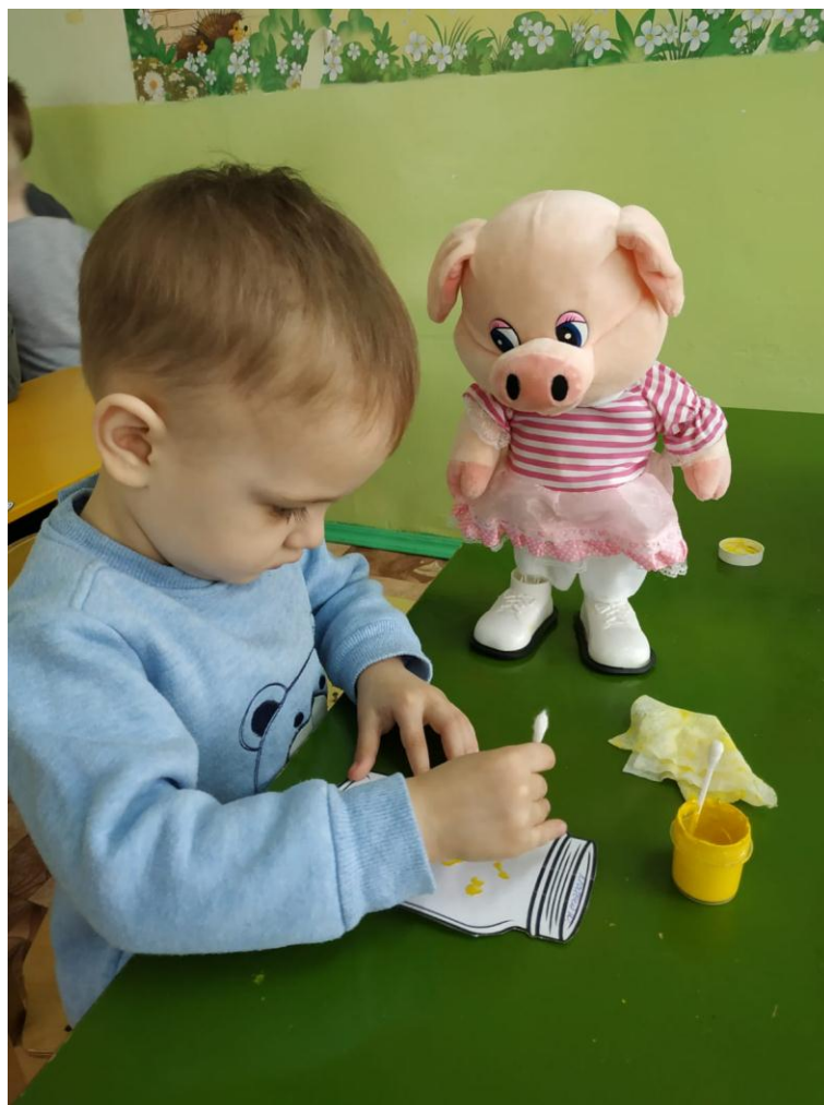
Рисование: «Витамины в банке»