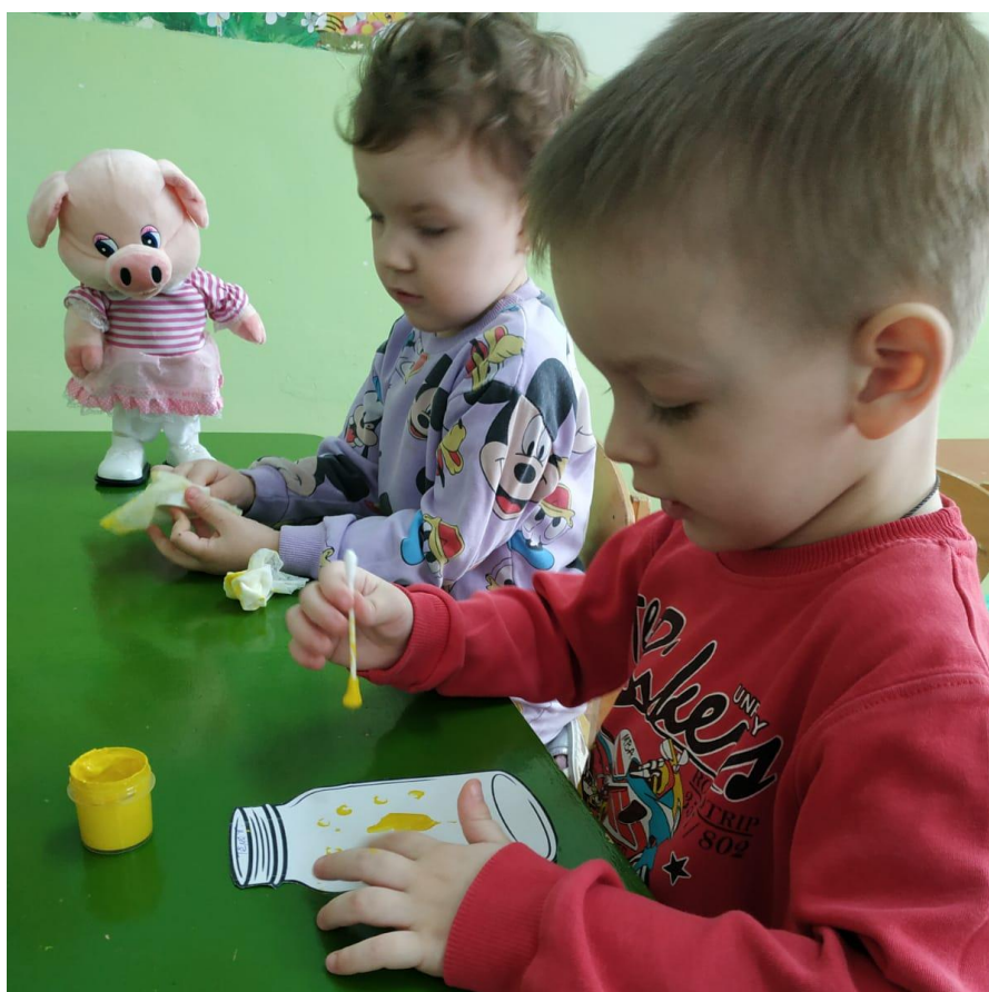
Рисуем витамины в банке (ватными палочками)